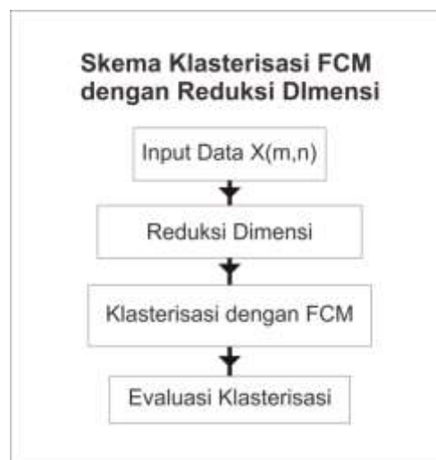
Gambar 2. Skema klasterisasi FCM dengan reduksi dimensi.

Data yang akan diklusterisasi, sebelumnya melalui proses reduksi dimensi. Dengan demikian proses komputasi pada proses klusterisasi dilakukan pada dimensi yang rendah. Hal ini juga sangat membantu untuk melakukan visualisasi data. Untuk mengetahui kualitas dari hasil klusterisasi maka akan dilakukan beberapa uji kualitas hasil klusterisasi. Gambar 2 menunjukkan skema reduksi dimensi pada fuzzy klustering