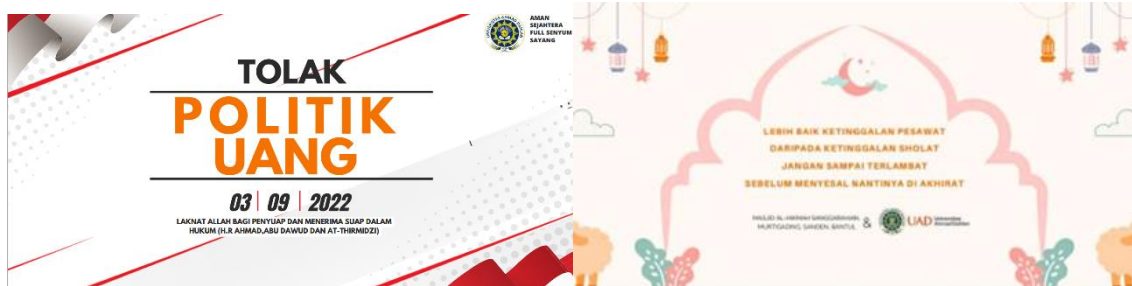
Gambar 3. Sebagian hasil pelatihan menulis “ outdoor banner ”

tujuannya. Lokasi fasilitas umum yang dipilih adalah masjid, pesan dari banner mengajar masyarakat muslim di pedukuhan setempat untuk sholat tepat waktu (Gambar 4).