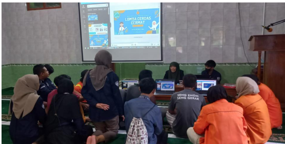
Gambar 2. Penyampaian materi pelatihan oleh dosen dan mahasiswa

Beberapa ide mengemuka, termasuk ide tentang kebersihan dan pengelolaan sampah, kesehatan, kegiatan keagamaan, bisnis warga dan hal-hal yang menjadi agenda pedukuhan seperti turut serta dalam menyukseskan program Bantul Bersih Sampah atau Bantul Bersama 2025. Setelah disampaikan pengantar pentingnya skill menulis untuk menyampaikan informasi kepada masyarakat, peserta mengikuti pelatihan untuk menuangkan pesan secara tertulis dengan memanfaatkan Canva. Dosen dan mahasiswa Universitas Ahmad Dahlan berkolaborasi dalam pelaksanaan pengabdian pada tahap ini (Gambar 2).