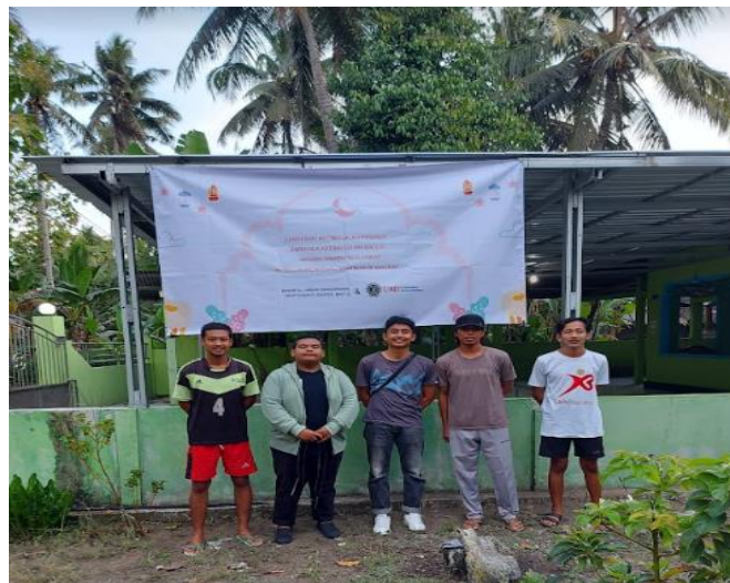
Gambar 4. Outdoor banner untuk tempat ibadah

Melalui kegiatan ini, peran serta pemuda dalam kegiatan kemasyarakatan semakin meningkat, khususnya melalui keterampilan dan kreativitas mereka dalam merangkai kata untuk menghasilkan dan menyampaikan informasi yang berguna kepada warga masyarakat.