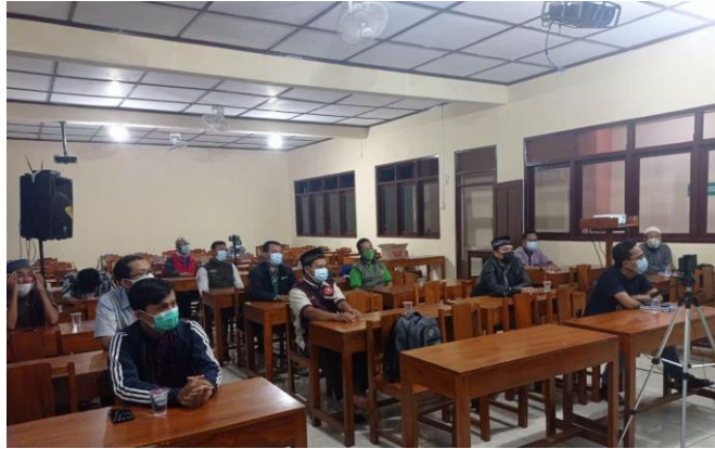
Gambar 2. Pelaksanaan Kegiatan Administrasi Masjid