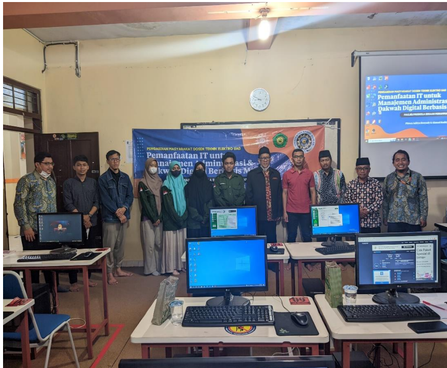
Gambar 4. Pelaksanaan Kegiatan Pelatihan Dakwah Digital Masjid