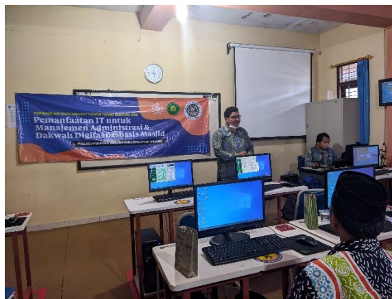
Gambar 3. Pelaksanaan Kegiatan Manajemen Keuangan

Pelatihan ini ditujukan takmir masjid di seluruh kawasan Kapanewon Imogiri yang merupakan Binaan Muhammadiyah Imogiri. Untuk pelatihan pemanfaatan TIK untuk manajemen keuangan masjid akan diajarkan penggunaan Microsoft excel dan penggunaan google form untuk tabulasi keuangan mulai dari infaq, zakat, dan shodaqoh termasuk pembelanjaan takmir untuk operasional dan pembangunan masjid. Kegiatan ini dilaksanakan 16 Oktober 2022 di Laboratorium Komputer SMK Muhammadiyah Imogiri seperti pada gambar 3.