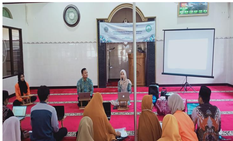
Gambar 2. Proses Pelatihan Ms.Excel

Proses penyampaian materi oleh pembicara secara tatap muka (luring) seperti terlihat pada Gambar 2 :