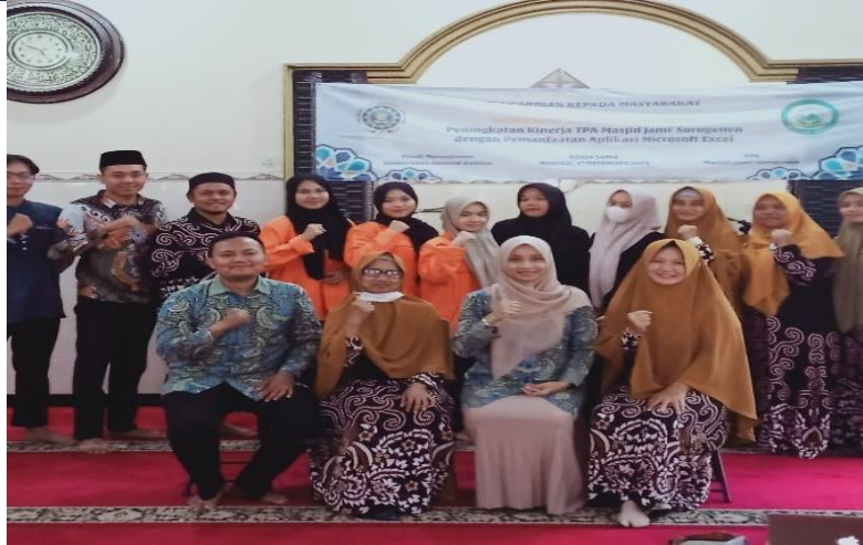
Gambar 4. Kebersamaan Kegiatan pengabdian masyarakat

Tim dosen pengabdian menyusun materi pengabdian masyarakat dengan mengintegrasikan TriDharma selama ini telah tertunaikan. Dalam kesempatan ini dosen pengabdian melakukan integrasi pendidikan dan pengajaran dengan mengangkat mata kuliah manajemen operasional dan kewirausahaan. Hal ini dilakukan dengan pengembangan serta pelatihan pengelolaan manajemen secara administratif dan menumbuhkan semangat inovatif didukung dengan ketrampilan yang ada pada aspek kewirausahaan sehingga bermunculan ide-ide baru dalam pengembangan Tpa Masjid Jami' Sorogonen. Ini membantu dalam kemampuan beradaptasi dengan cepat dalam perubahan dan pemanfaatan peluang yang ada.