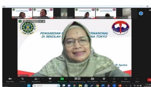
Gambar 1d. Sambutan Kepala Sekolah