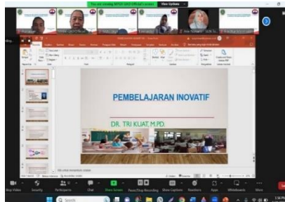
Gambar 1a. Penyampaian Materi

kreatif dimulai jam 08.30 sampai dengan jam 13.00 dilanjutkan diskusi refleksi dari guru yang telah menerapkan pembelajaran dengan metode pembelajaran kreatif didampingi oleh pengabdian sampai dengan jam 15.00 kegiatan berikutnya tanggal 29 November 2023 dengan kegiatan pokok pendampingan penerapan media pembelajaran dengan XR pada pembelajaran di kelas dan dilanjutkan diskusi refleksi terhadap pemanfaatan media pembelajaran dengan XR yang sudah diimplementasikan dalam kegiatan belajar mengajar dilaksanakan jam 8.30 sampai dengan jam 15.00 bersama pengabdian.