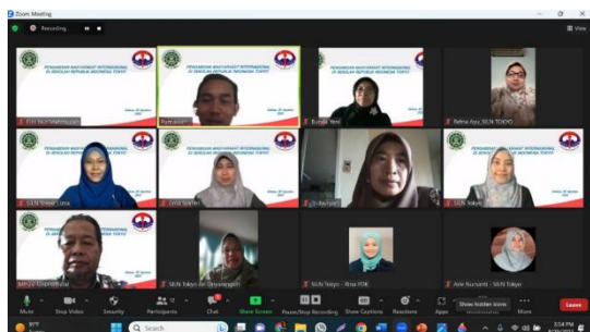
Gambar 1c. Peserta kegiatan PkM SRIT