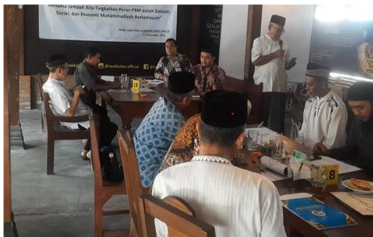
Gambar 4. Foto Kegiatan FGD

Organisasi pimpinan ranting berbasis keagamaan dan sosial sehingga untuk meningkatkan kinerja organisasi masih perlu untuk pendampingan serta dorongan dari berbagai pihak. Organisasi pimpinan ranting sangat membutuhkan kerjasama dari berbagai lembaga dan instansi amal usaha muhammadiyah untuk menjalankan kegiatan-kegiatan yang sudah di programkan. Kehadiran kegiatan PkM ini sangat membantu organisasi pimpinan ranting dalam merealisasikan kegiatan-kegiatan yang selama ini kurang aktif. Seluruh pengurus pimpinan ranting juga sangat senang dengan ditunjukan dengan keterlibatan secara aktif dalam setiap kegiatan yang dilaksanakan selama PkM. Hasil dan dampak dari kegiatan PkM ini sangat luar biasa sehingga mampu menambah pemahaman dan pengetahuan yang lebih baik, kemudian ketrampilan dari para pengurus pimpinan ranting juga meningkat khususnya dalam pengelolaan dan tata kelola organisasi pimpinan ranting. Selain itu pelayanan dan pendapatan serta kesehatan pengurus pimpinan ranting juga semakin meningkat. Kegiatan tersebut dilaksanakan dalam bentuk FGD seperti pada gambar foto di bawah ini.