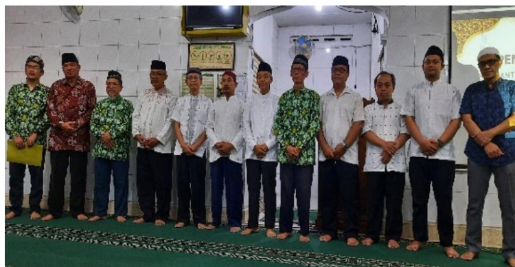
Gambar 3. Foto Kegiatan Pendampingan.

Pelaksanaan kegiatan PkM tahap 1 (satu) sudah direalisasikan dengan baik dan lancar pada masa semester Gasal 2023/2024 tepatnya pada hari Rabu tanggal 24 Robi'ul Akhir 1445 H dan bertepatan pada tanggal 08 November 2023 M, pukul 19.30 – 21.30 wib di tempat Masjid Al-Furqon Kleben-Kuncen Yogyakarta dan di hadiri oleh seluruh pengurus pimpinan ranting sebanyak 39 orang. Selanjutnya dilakukan pendampingan dengan tema perumusan tata kelola pimpinan ranting dengan metode FGD yang dilaksanakan pada hari Ahad tanggal 4 Jumadil Akhir 1445 H dan bertepatan pada tanggal 17 Desember 2023 M, pukul 09.30 – 12.30 wib di tempat Resto Iwak Kalen Sleman dan di hadiri oleh seluruh pengurus pimpinan ranting sebanyak 42 orang. Selanjutnya waktu pelaksanaan kegiatan PkM tahap 2 (dua) sudah dilaksanakan pada hari Ahad tanggal 31 Maret 2024 pada semester Genap 2023/2024. Kedua kegiatan tersebut sudah terlaksana dengan sukses dan lancar serta dilaksanakan secara luring. Berikut foto bersama kegiatan pendampingan tata kelola organisasi ranting muhammadiyah.