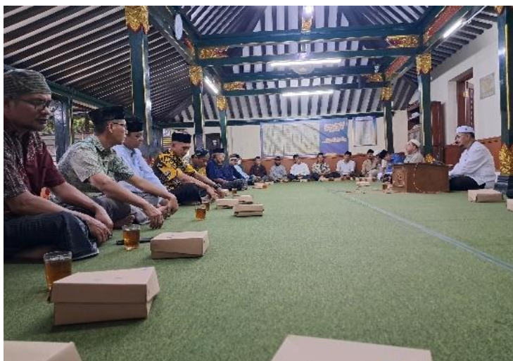
Gambar 5. Foto Pemberdayaan Umat

Pada Gambar 4, menjelaskan bahwa hasil kegiatan PkM dalam bentuk pendampingan dan FGD untuk peningkatan tata kelola menuju organisasi yang lebih berkemajuan berbasis pada Good Muhammadiyah Governance (GMG) mulai ada pergerakan dan peningkatan dengan dilaksanakannya kegiatan secara rutin dan terjadwal dalam rangka untuk menyemarakkan dan meningkatkan kegiatan beribadah sesuai dengan ajaran Al-qur'an dan Hadist yang direkomendasikan oleh Muhammadiyah. Selain itu untuk mengembangkan keterampilan mencakup manajemen organisasi, komunikasi, negosiasi, dan keterampilan interpersonal lainnya juga sudah mulai bergerak kearah yang menggembirakan. Serta melakukan perumusan penjadwalan kegiatan dakwah islam secara terstruktur dan transparan dengan metode secara bergantian dan berpindah-pindah lokasi dakwah di masjid-masjid seputar wilayah Pakuncen Yogyakarta. Kegiatan program PkM ini sudah diimplementasikan dengan keterlibatan seluruh pengurus harian dan anggota PRM Kuncen secara intensif dalam perumusan dan peningkatan tata kelola organisasi PRM Kuncen menuju organisasi yang lebih berkemajuan berbasis pada GMG seperti pada gambar foto di bawah ini.