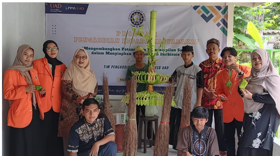
Gambar 2: Hasil produk para santri dari limbah kelapa