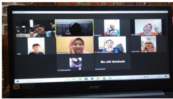
Gambar 3. Sesi 2 (Siang) Kelas 1 24 Agustus 2021