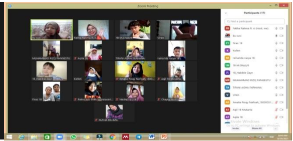
Gambar 2. Sesi 1 (Pagi) Kelas 1 24 Agustus 2021