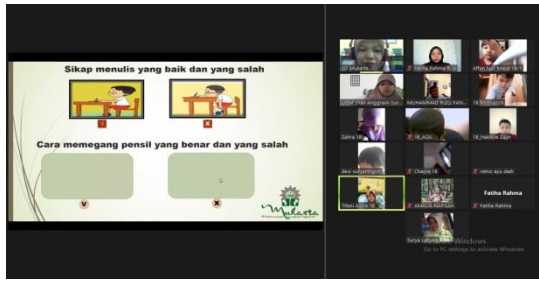
Gambar 1. Sesi 1 (Pagi) Kelas 1 19 Agustus 2021