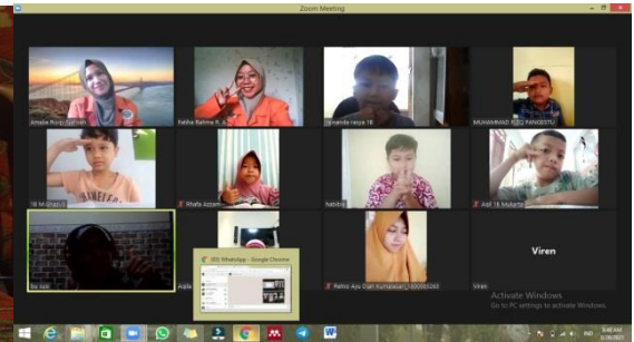
Gambar 6. Sesi 1 (Pagi) Kelas 1 26 Agustus 2021