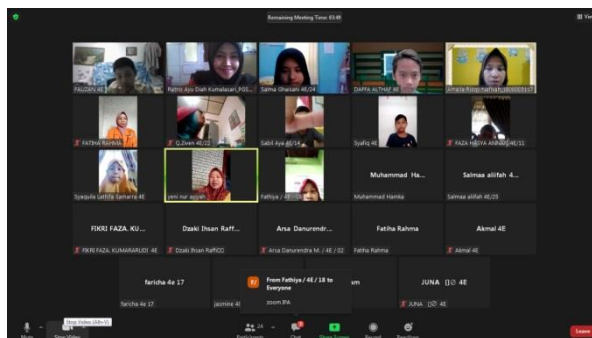
Gambar 9. Sesi 2 (Sore) Kelas 4 1 September 2021

Hasil penelitian menunjukkan bahwa di era pandemi covid-19 ini tidak menurunkan semangat siswa SD Muhammadiyah Karangkajen 2 Yogyakarta untuk tetap belajar secara daring atau online. Semangat ini tidak lepas dari peran guru dalam membimbing dan membantu siswa dalam kegiatan belajar mengajar sehingga dapat menumbuhkan semangat belajar siswa dalam pembelajaran daring tersebut. Guru selalu aktif memberikan dukungan semangat dalam kegiatan belajar mengajar sehingga dapat menumbuhkan semangat belajar siswa SD Muhammadiyah Karangkajen 2 Yogyakarta di Era Pandemi Covid-19.