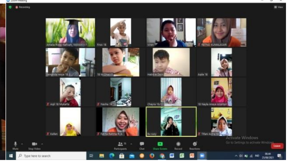
Gambar 4. Sesi 1 (Pagi) Kelas 1 25 Agustus 2021