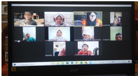
Gambar 5. Sesi 2 (Sore) Kelas 1 25 Agustus 2021