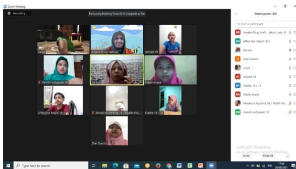
Gambar 7 Sesi 2 ( Sore ) Kelas 1 26 Agustus 2021