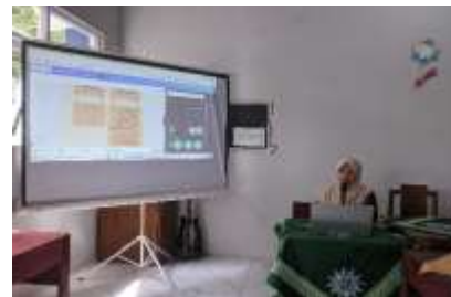
Gambar 3b. Peserta Mempresentasikan Hasil LKPD yang Telah Dibuat