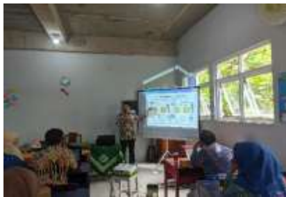
Gambar 3a. Peserta Mempresentasikan Hasil LKPD yang Telah Dibuat

Di hari kedua peserta telah membuat LKPD sesuai secara berkelompok dan dilakukan pendampingan. Peserta membuat LKPD sesuai dengan materi yang diampu, hal ini sesuai dengan (9) dalam pengabdiannya peserta membuat LKPD sesuai dengan materi yang diajarkan, Hasil yang telah diperoleh selanjutnya dipresentasikan untuk diberi masukan demi kesempurnaan LKPD yang telah dibuat. Gambar 4 menampilkan peserta melakukan presntasi hasil LKPD yang telah dibuat.