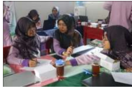
Gambar 3b. Peserta Melakukan Diskusi dengan Didampingi Tim Pengabdian