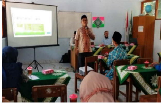
Gambar 1. Materi tentang Penguatan SDM Dari Perspektif PAI Menghadapi Masa Pandemi Covid-19

masyarakat (PKM) ini dibuka oleh pimpinan ranting Muhammadiyah Samigaluh Kabupaten Kulonprogo Yogyakarta, seperti tampak pada Gambar 1, 2, dan 3.