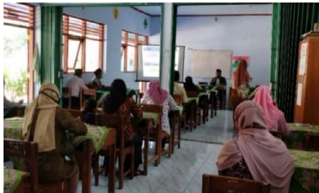
Gambar 2. Materi tentang Penguatan SDM Dari Perspektif Psikologis Menghadapi Masa Pandemi Covid-19