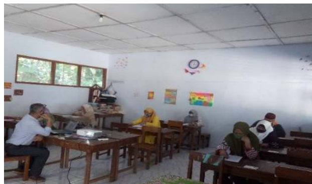
Gambar 3. Materi tentang Penguatan SDM Dari Perspektif Ekonomi Menghadapi Masa Pandemi Covid-19