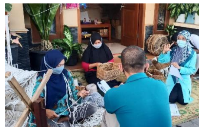
Edukasi Standarisasi Produksi