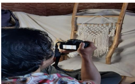
Dokumentasi Katalog Produk