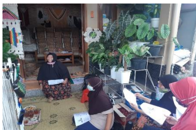
Edukasi Manajemen Pemasaran

Berdasarkan tabel 1, Peningkatan Pengetahuan dan Ketrampilan diperoleh peningkatan pengetahuan dan ketrampilan secara signifikan sehingga tidak ada lagi tenaga kerja yang tidak faham dalam melaksanakan promosi dan pemasaran produk dimasa pandemi COVID-19. Namun hal ini masih belum bisa menjamin peningkatan penjualan dikarenakan pandemi masih berlangsung sehingga berdampak pada penurunan semua fungsi perekonomian dunia.