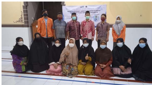
Gambar 2. Penyusunan dan pendampingan kurikulum madrasah integritas secara luring

Gambar diatas menunjukkan bahwa adanya semangat dalam menyusun dan mengembangkan kurikulum di TPA nya. Setiap TPA mempunyai kurikulum masing masing, namun perlu adanya kurikulum yang berintegrasi dengan madrasah integritas. Kurikulum tidak terlepas dari pengajar TPA, Sehingga perlu banyak melakukan pembinaan dan pembinaan bagi pengajar agar mampu mengembangkan kurikulum yang memasukan unsur nilai-nilai karakter integritas. Pengajar dapat mengembangkan pembelajaran dengan memasukan unsur karakter. Dengan demikian pendampingan pembuatan kurikulum madrasah integritas dan pendampingan KBM di masing-masing TPA sangat penting dilakukan, dalam upaya meneruskan dan melanjutkan edukasi nilai-nilai integritas.