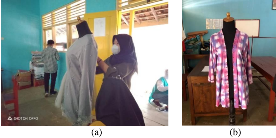
Gambar 3. Salah satu produk yang dibuatkan oleh kader Mitra (a,b)

Materi yang disampaikan terdiri dari beberapa tema seperti Peluang dan tantangan berwirausaha, Memilih peluang usaha sesuai minat dan bakat dari kader mitra, dan pembentukan karakter siswa. Hasil yang didapatkan pada penyampaian materi siswa SMK mengalami peningkatan pengetahuan kewirausahaan yang dilihat dari hasil pretest dan posttest (gambar 1) yang merupakan salah satu tolak ukur keberhasilannya. Kegiatan akhir pada program ini adalah mitra kader diberikan challenge untuk memproduksi hasil karyanya dan akan di pasarkan di media sosial.