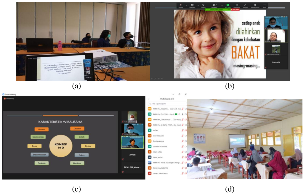
Gambar 2. Penyampaian materi yang dilaksanakan daring (a,b,c). penyampaian materi secara luring (d)

Materi yang disampaikan terdiri dari beberapa tema seperti Peluang dan tantangan berwirausaha, Memilih peluang usaha sesuai minat dan bakat dari kader mitra, dan pembentukan karakter siswa. Hasil yang didapatkan pada penyampaian materi siswa SMK mengalami peningkatan pengetahuan kewirausahaan yang dilihat dari hasil pretest dan posttest (gambar 1) yang merupakan salah satu tolak ukur keberhasilannya. Kegiatan akhir pada program ini adalah mitra kader diberikan challenge untuk memproduksi hasil karyanya dan akan di pasarkan di media sosial.