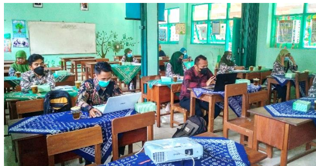
Gambar 2. Kegiatan pelatihan dan pendampingan