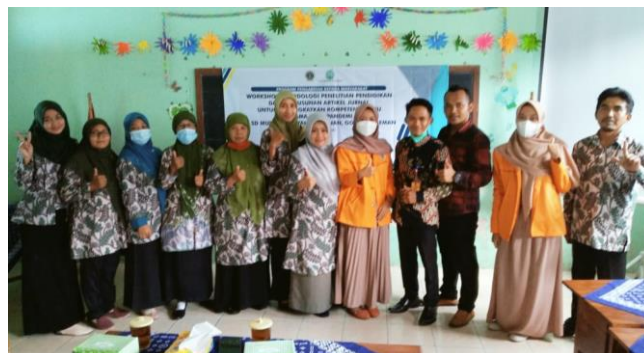
Gambar 3. Foto pemateri bersama peserta