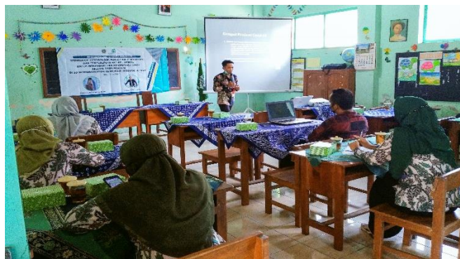
Gambar 1. Penyampaian materi