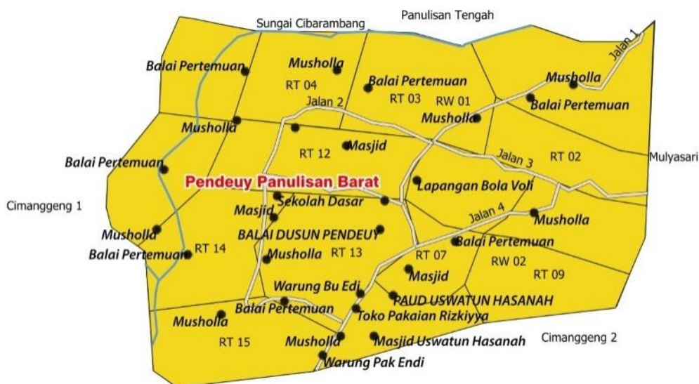
Gambar 2. Peta Digital Peundeuy